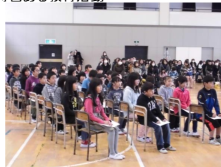
夢と志を拓く「二分の一成入式」