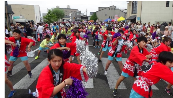
PTA・地域とともに「塩竈みなとまつり」