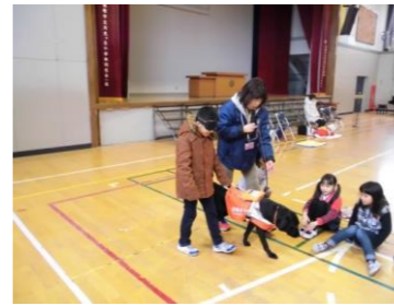
盲導犬との交流学習