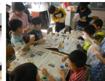
児童会行事「月見祭」