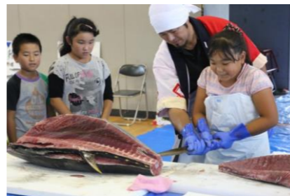
塩竈の食の体験 マグロの解体