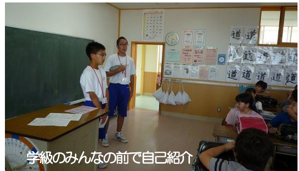
学級みんなの前で自己紹介

7月10日(火)、11日(水)の2日間、玉川中学校から月見ヶ丘小学校出身の2名を含む3名の生徒が来校し、職場体験学習をしました。月見ヶ丘小学校の子どもたちに勉強を教えたり、一緒に遊んだりしながら、貴重な2日間を過ごしました。自分たちに年齢の近い卒業生ということで、月見ヶ丘小学校の子どもたちも大喜びでした。