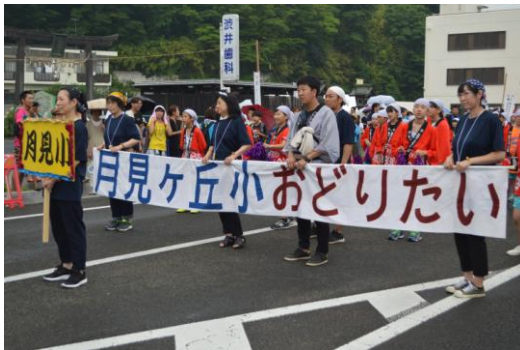
「月見ヶ丘おどりたい」のスタート

これまで、本番に向けて業間の休み時間や放課後、土曜日なども練習を重ねてきた子どもたちに熱い声援をいただき、ありがとうございました。また、よしこの塩竈実行委員の皆様をはじめサポーターとしてご協力いただいた多くの保護者の皆様にも心から感謝申し上げます。ありがとうございました。