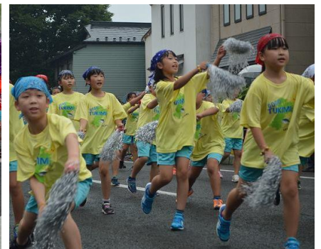
黄色のTシャツで元気いっぱい踊る