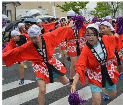
6年生 小学校最後のパレード参加